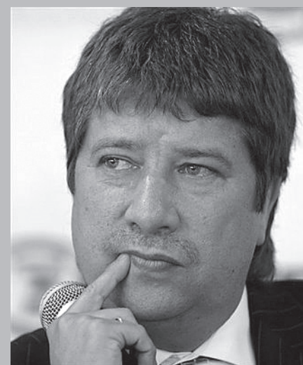
Hernán Darío Gómez

En conferencia el nuevo técnico chapín, manifestó: “La decisión la tomé porque me ofrecieron una oportunidad seria. Tuve propuestas en Qatar, México y la de Colombia”. Sobre el fútbol guatemalteco manifestó “Sé que estuvieron muy cerca de clasificar y que les faltaron cinco centavos para el peso... esperemos completarlo”.