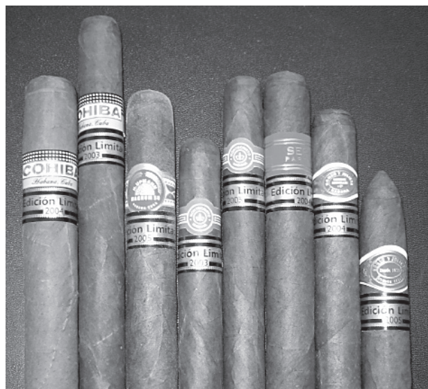
Por Marco López.

Actualmente conocer u obtener informacion de un país es tan fácil que no solo podemos encontrar informacion en un libro, revista, periódico y no digamos que por medio de la Internet en unos segundos tenemos la informacion precisa. Pero imaginémonos en el siglo XIX, la informacion era poca y las referencias